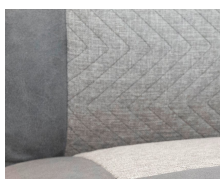
+ Tappezzeria Hygge