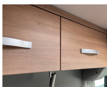
+ Mobilio Cape Town