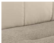
+ Tappezzeria Torcello *