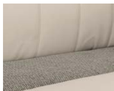
+ Tappezzeria Chaleur