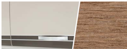
+ Mobilio Rovere Virginia