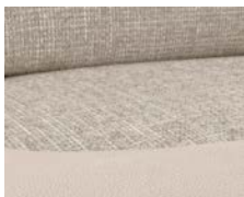
+ Tappezzeria Goa *