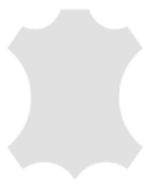
+ Personalizzazione tappezzeria in vera pelle *