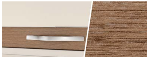
+ Mobilio Rovere Virginia