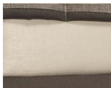
+ Tappezzeria Amaro