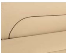
+ Tappezzeria in vera pelle Skylight *