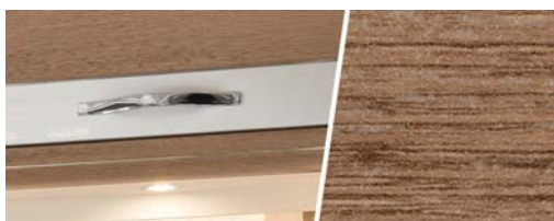
+ Antine in alternativa (Rovere Virginia con Mastergloss Alaska White) *