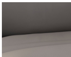
+ Tappezzeria in vera pelle Collin *