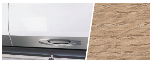
+ Mobilio Ambres Oak