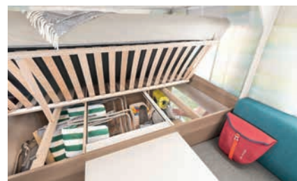
» Rete a doghe con estremità in gomma elastica, sollevabile per un maggiore spazio di stivaggio