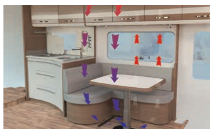
» Sistema Air-Plus per la retroventilazione dei mobili