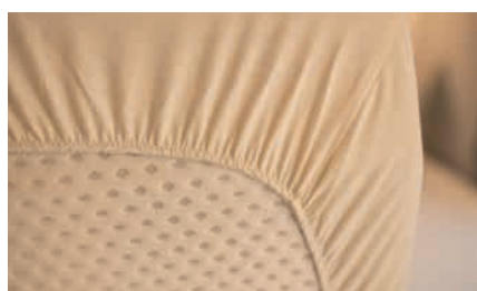
» Materassi a schiuma fredda per tutti i letti singoli o matrimoniali