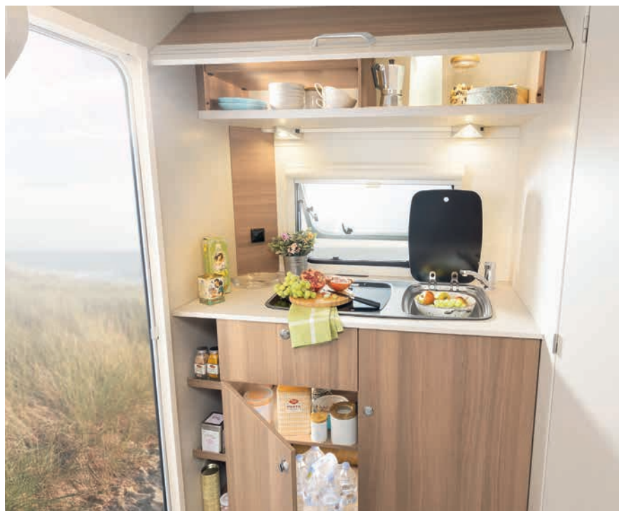
» Pensili spaziosi in cucina