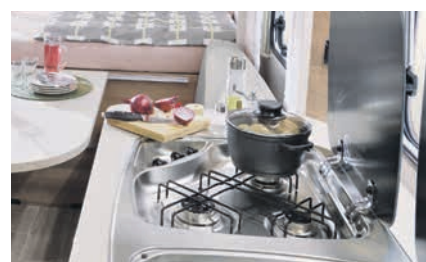
» Pratico fornelli a 3 fuochi con accensione manuale