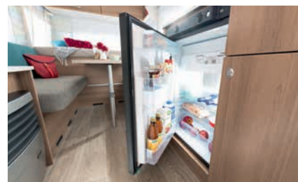
» Ampio frigorifero con 81 l di volume e freezer da 10 l (a seconda dei layout, controllare dati tecnici)