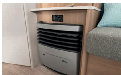
» Riscaldamento ad aria calda, alta prestazione