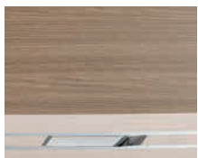
+ Sambesi Oak