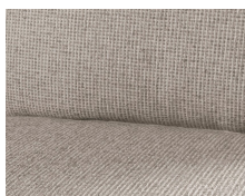
+ Tappezzeria parzialmente in pelle Heron ○