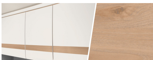
+ Mobilio Noce Nagano