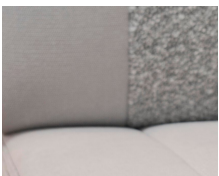
+ Tappezzeria Scandi