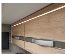
+ Mobilio Noce Nagano