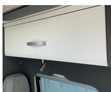
+ Mobilio Amberes Oak