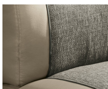
+ Tappezzeria Camino