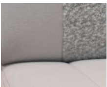
+ Tappezzeria Scandi