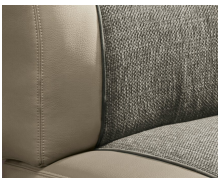
+ Tappezzeria Camino