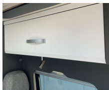
+ Mobilio Amberes Oak