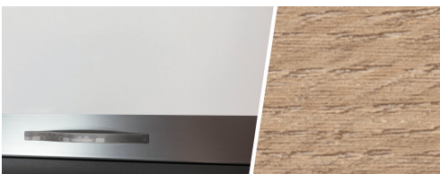
+ Mobilio Amberes Oak