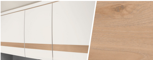
+ Mobilio Noce Nagano