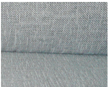
+ Tappezzeria Drake